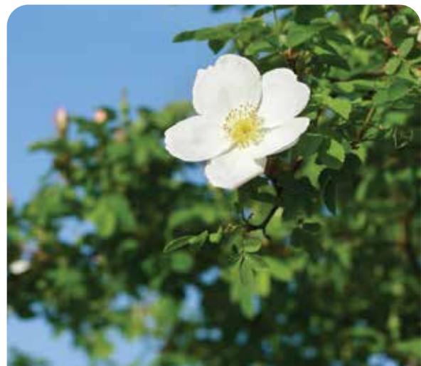
Zierpflanzen mit ungefüllten Blüten

Es sollten auch speziell krankheitsresistente oder -tolerante Sorten gewählt werden, um den Pflegeaufwand möglichst gering zu halten.