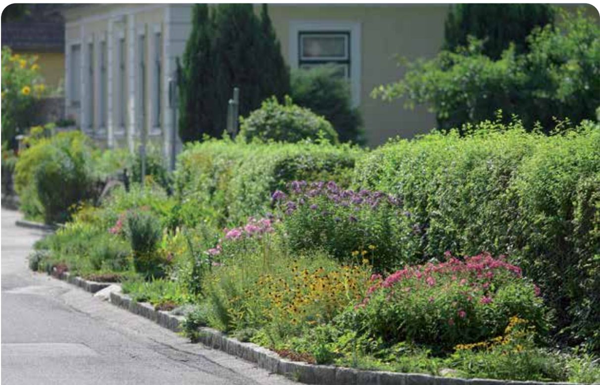
Staudenbeet mit sonnenliebenden Stauden

Der Pflegeaufwand ist geringer, wenn Pflanzen mit gleichen Bedürfnissen in ein Beet gepflanzt werden. Pflanzen mit ähnlichem Platzbedarf und vergleichbarer Konkurrenzkraft werden kombiniert, ebenso sollen Wasser- und Lichtbedarf zusammenpassen.