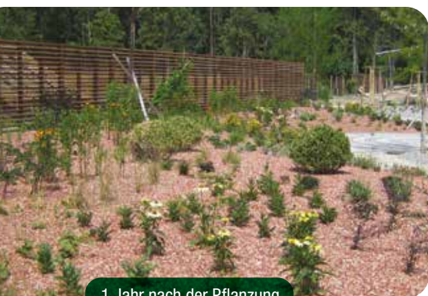
1 Jahr nach der Pflanzung

Qualitätsware ist optimal durchwurzelt, frei von Krankheiten, Schädlingen und Beikräutern. Dennoch stark verwurzelte Wurzelballen reißen Sie auf und wässern diese vor dem Auspflanzen gründlich. Ausgepflanzt wird bodeneben in frostfreie Böden. Andrücken, Gießen und Mulchen nicht vergessen.