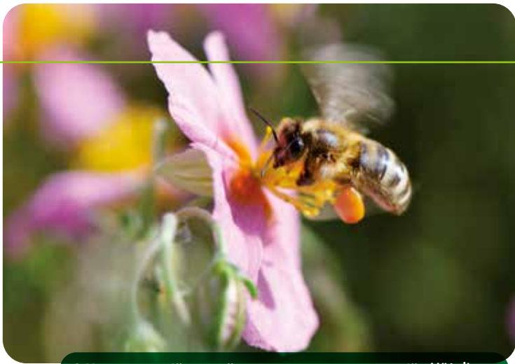
Offene, ungefüllte Blüten sind Futterquellen für Nützlinge.