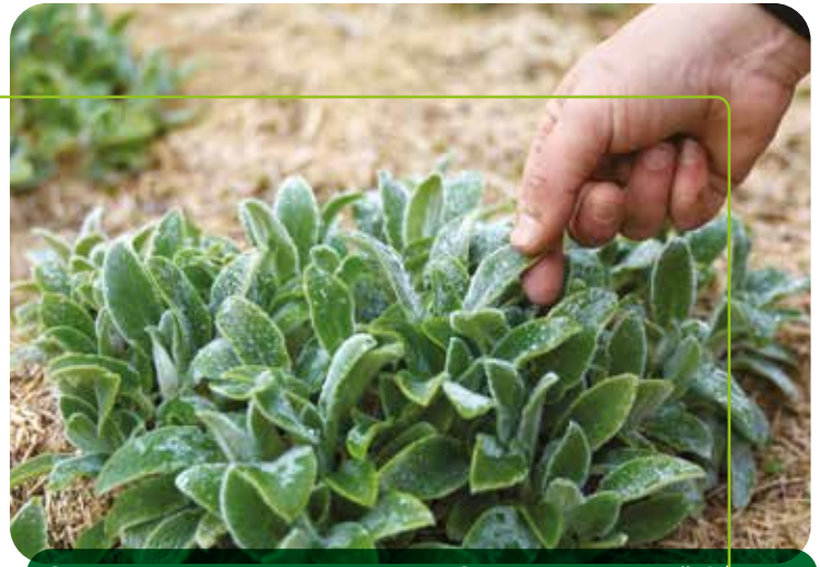
Stauden geht es besser, wenn der Standort ihren Bedürfnissen entspricht.