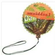
Naturforscher Drehscheibe: Laubbäume,