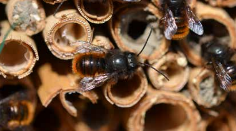
Wild lebende Verwandte der Honigbiene: Mauerbienen zählen zu den häufigsten Bewohnern des Nützlingshotels.