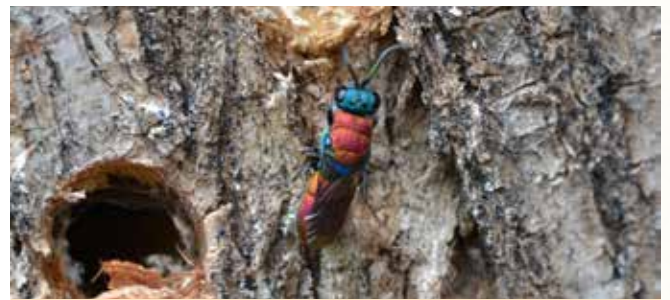
Goldwespen sind wunderschön und winzig, aber dennoch gefräßige Räuber am Wildbienenhotel.

Kuckucksbienen, Goldwespen, Schlupfwespen oder Taufliegen treten als Nestparasiten auf. Ihre Brut ernährt sich von den Wildbienenlarven. Spechte, Meisen und andere Vögel haben ebenfalls das Nützlingshotel als Futterplatz entdeckt. Sie picken die Hölzer auf und ziehen die besiedelten Stängel heraus, um die Bienenlarven zu fressen. Ein Vogelschutzgitter kann die Larven schützen, aber auch die Fraßfeinde haben ein Recht zu leben, zumal sie häufig ebenfalls selten sind.