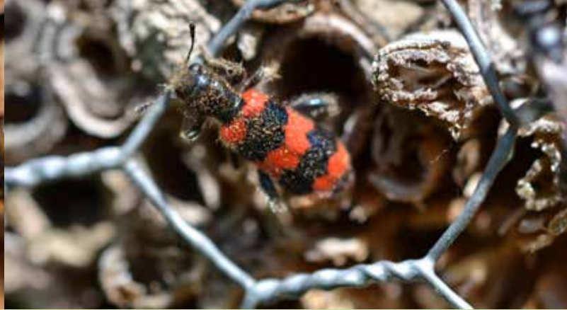
Der Immenkäfer ist ein Nestparasit, der den Bruterfolg der Wildbienen reduzieren kann.