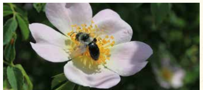
In offenen Blüten sind Nektar und Pollen gut zugänglich für Wildbienen und andere Insekten.

Ein vom Frühjahr bis zum Herbst vielfältig blühender Garten versorgt die Bewohner des Nützlingshotels mit Nahrung. Besonders geeignet sind Korbblütler, Schmetterlingsblütler, Kreuzblütler, Lippenblütler, Weiden und Obstbäume.