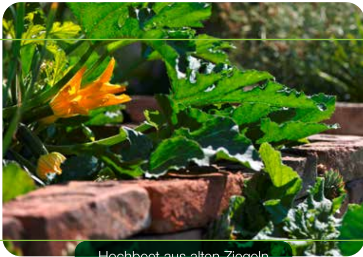
Hochbeet aus alten Ziegeln