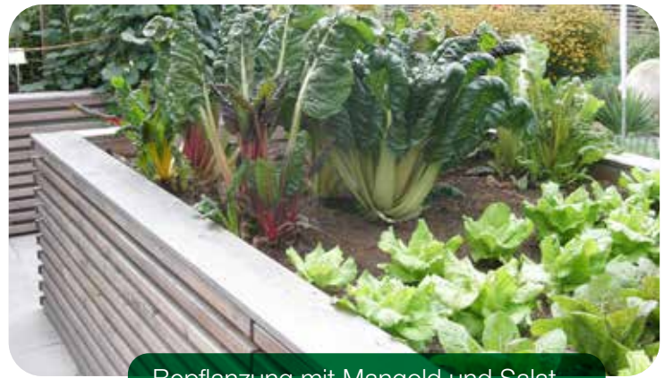
Bepflanzung mit Mangold und Salat