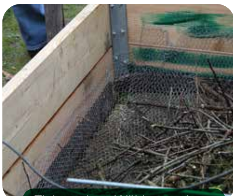
Einbau eines Wühlmausgitters

Am Boden und bis zu einer Höhe von ca. 15 cm sollten die Seitenwände unbedingt mit einem Wühlmausgitter ausgelegt werden. Diese ungebetenen Gäste lieben Hochbeete.