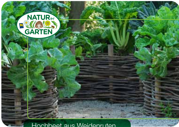
Hochbeet aus Weidenruten