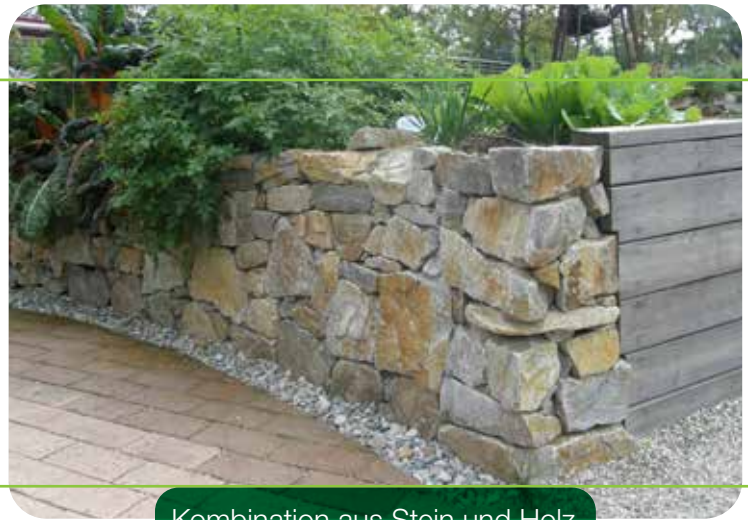
Kombination aus Stein und Holz