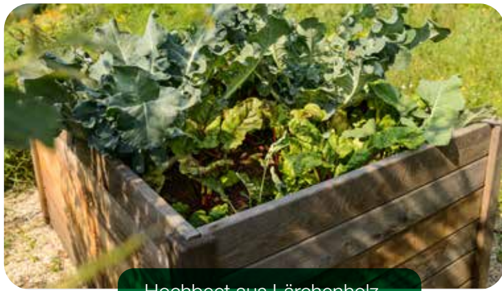
Hochbeet aus Lärchenholz