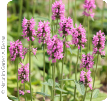
© Natur im Garten A. Benes