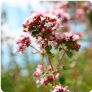
© Natur im Garten J. Brooks