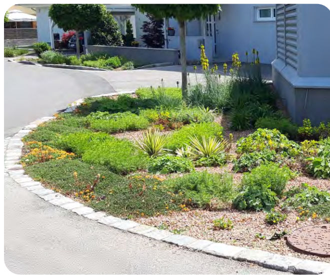
Regenwasser lässt sich gut durch Versickerungsbeete nutzen.

Unbelastete Wässer von Dachrinnen oder Gehsteigen dürfen in Beete eingeleitet werden. Regenwasser von Straßen nur dann, wenn es vorher durch einen entsprechenden Filterkanal oder durch eine Filterschicht sickert.