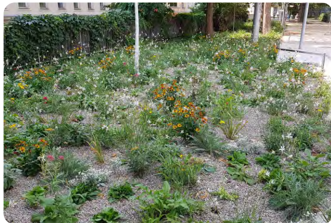
Ein noch junges, gut angewachsenes Staudenbeet.

Luftblasen mehr aufsteigen. Dann werden sie in dem empfohlenen Abstand bzw. nach dem erstellten Pflanzplan auf dem Beet verteilt. Erst wenn alle Stauden am Beet verteilt sind, beginnt die eigentliche Pflanzung. Wird das Beet gemulcht, dann wird das Mulchmaterial mit oder gleich nach dem Setzen aufgebracht. Dieser Punkt wird später näher erklärt. Nach der Pflanzung wird gründlich eingegossen. In den kommenden Wochen wird beobachtet, wie die Pflanzen gedeihen und Beikräuter möglichst jung entfernt. Bei trockener Witterung muss in der Anwuchsphase zusätzlich gegossen werden.