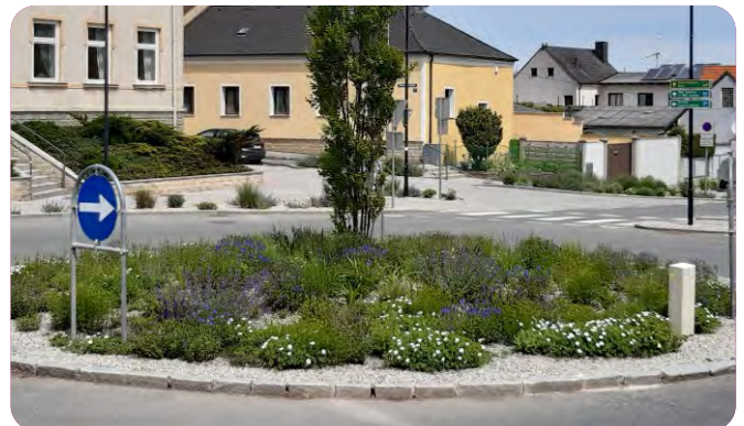
Attraktives Straßenbegleitgrün: Mit der richtigen Staudenauswahl lassen sich auch heiße und trockene Standorte begrünen. Ein Beet in Loosdorf (Bild oben), Kreisverkehr in Gänserndorf (Bild darunter).

Heimische Stauden fördern die Biodiversität. Sie können auch gut mit anderen Stauden kombiniert werden.