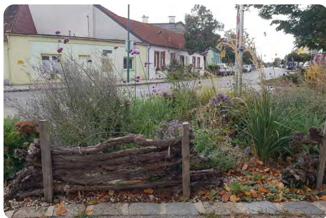
Ein Staudenbeet lässt sich als Lebensraum für Insekten gestalten.

Blüten und Blumen sind bei den Bürgerinnen und Bürgern beliebt. Es ist wichtig, eine Balance zwischen Attraktivität und vertretbarem Pflegeaufwand zu finden. Die Gemeinde kann außerdem Vorreiter sein, um neue Ideen einzubringen, etwa die Verwendung von heimischen Stauden oder klimawandelangepassten Pflanzungen. Kennzeichnen Sie solche Vorbildpflanzungen mit Schildern.