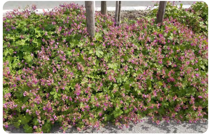
Der Balkan-Storchnabel wächst dicht, ist pflegeleicht und bei Bienen beliebt.

werden, raten wir zu plastikfreien Vlies-Materialien. Eine Alternative zum Mulchen sind flächige Pflanzungen mit sehr dicht wachsenden Stauden, die einen ähnlichen Effekt wie das Mulchen selbst haben. Dafür eignen sich beispielsweise der Schlangen-Knöterich ( Bistorta officinalis ) oder der Balkan-Storchnabel ( Geranium macrorrhizum ).