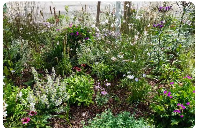
Eine gut geplante Staudenmischung harmoniert mit dem Standort.

Bezüglich der Größe eines Staudenbeetes ist es so,