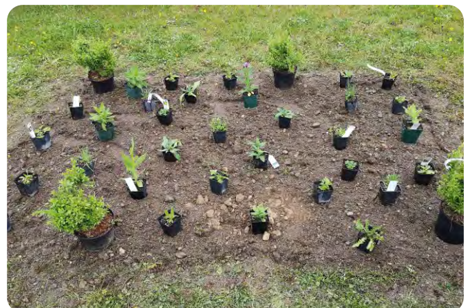
Die Stauden werden erst am Beet verteilt und dann gepflanzt.

75-80% mineralischer Anteil (z.B. Gräder oder ungewaschener Splitt 0/4) und 10-15% organischer Anteil (Humus, Kompost oder gesiebte Ackererde). Natürlich muss auch dieses Substrat frei von Samen oder Wurzelunkräutern sein.