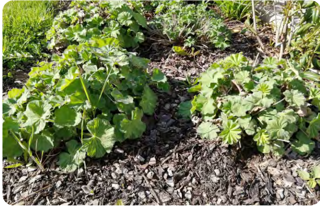
Holzhäcksel zum Mulchen können in vielen Gemeinden selbst hergestellt werden.

Nicht empfohlen für Staudenbeete wird frischer Rindenmulch, die im Bast enthaltenen Phenole hemmen beim Abbau den Wuchs der Stauden. Rindenmulch ohne Bastanteil ist unproblematisch. Mulchfolien oder -vliese werden aus Umwelt-schutzgründen nicht empfohlen. Bei einer dichten Staudenbepflanzung werden so viele Löcher in das Vlies geschnitten, dass ihre Anwendung keinen Sinn macht. Sollten sie dennoch benutzt