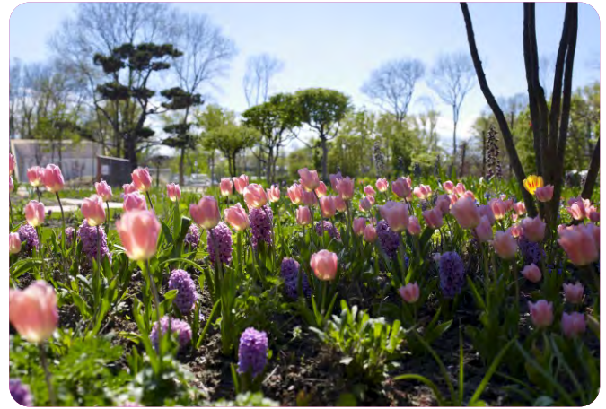
Mit Blumenzwiebeln wird die Blütezeit verlängert.

Staudenbeete lassen sich wunderbar mit anderen Pflanzen kombinieren, etwa mit Kleinsträuchern, kleinen Koniferen, Rosen und Bäumen. Werden Zwiebelpflanzen wie Tulpen und Narzissen gepflanzt, verlängert sich die Blütezeit. Sie beginnt dann bereits im zeitigen Frühling. Damit die Zwiebeln nach der Blüte in Ruhe einziehen können, kombiniert man sie mit Stauden, die die Blätter nach dem Abblühen verdecken.