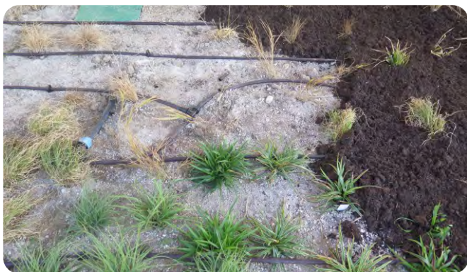
Bei sehr großer Trockenheit kann Bewässerung helfen, am besten durch wassersparende Tropfschläuche statt Regner.

Umgekehrt können Staudenbeete auch als Versickerungs- bzw. Wasserspeicherfläche dienen.