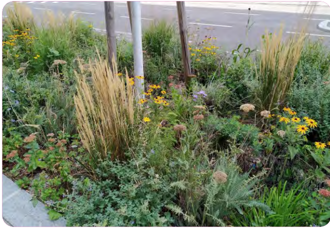
Stauden eignen sich hervorragend als Baumunterpflanzung.

Durch die große Auswahl an Stauden lässt sich für so gut wie jeden Standort eine passende Kombination finden. Es gibt einige Arten, die sich z.B. für sehr sonnige und trockene Standorte eignen, wo Rasen oder Sommerblumen in heißen Sommern nur durch intensive Bewässerung attraktiv bleiben können. Auch an schattigen Standorten wie etwa unter Bäumen haben sich Stauden bewährt. Wildstauden sind besonders robust und haben den Vorteil, dass sie für Insekten und Vögel ergiebige Nahrungsquellen sind sowie Insekten und Kleintieren Unterschlupf bieten.