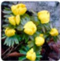
Eranthis hyemalis Winterling