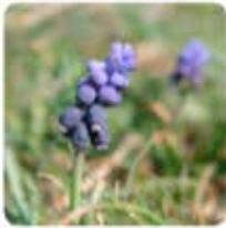
Muscari neglectum Traubenhyazinthe